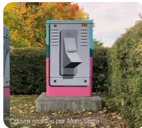
Oeuvre réalisée par Marc Serre